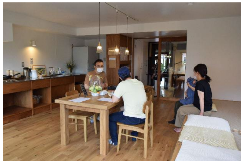
家族同士の団らん、お子様の遊びの場として