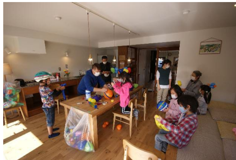
皆んなで楽しく遊ぶ場として