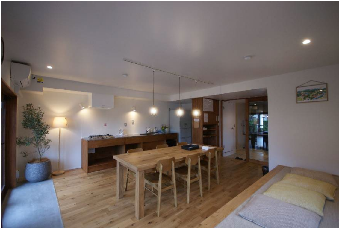
リビングスペース

レジデンス名倉とメゾン・ド・アムールのもう一つの共用リビングとして、より豊かな日々の暮らしが広がります。