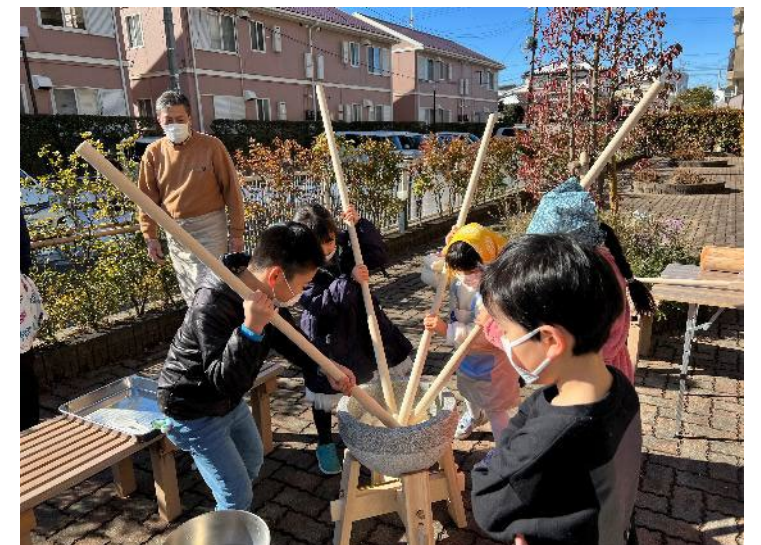
皆さんが集まれる共用の庭として