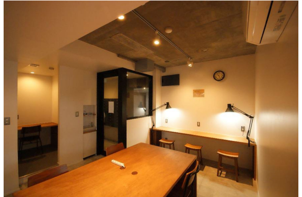
ワーキングスペース