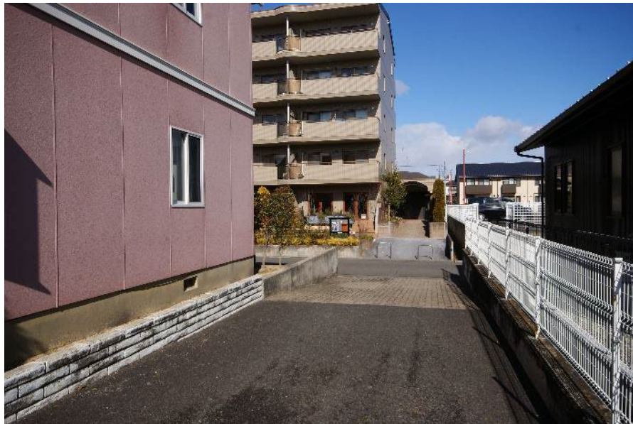
メゾン・ド・アムールから「里守ひろば」を見る