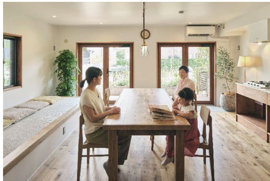
レジデンス名倉「里守ひろば」