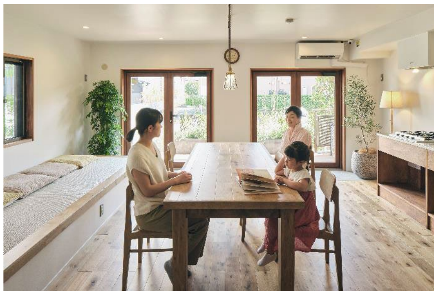
「里守ひろば」リビングスペース